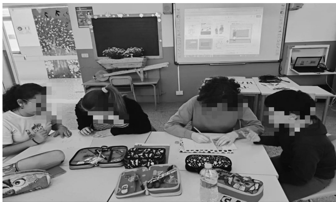
La Redazione impegnata nel redigere gli articoli